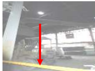
↑ 踏穿屋頂垂直墜落