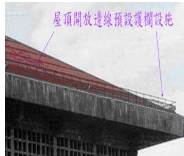
屋頂開放邊緣預設護欄設施