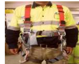
↑ 背負式安全帶 (雙掛鉤)