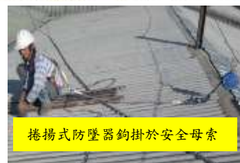
捲揚式防墜器鉤掛於安全母索