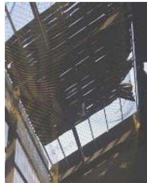
↑ 施作區域設安全網