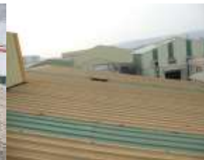
↑ 鐵皮屋頂中採光罩